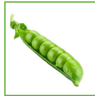
PISELLI 1 BUSTA