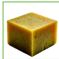
DADO BRODO VEGETALE 1