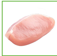
POLLO 1 VASCHETTA 300g