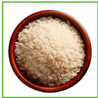
RISO 4 BICCHIERI