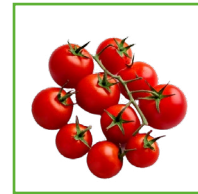
POMODORINI 1 VASCHETTA