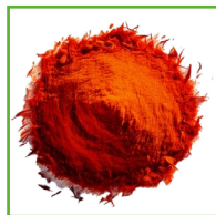
ZAFFERANO 2 BUSTINE