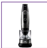
FRULLATORE A IMMERSIONE